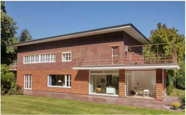
Haus Jahn | Soest | Entwurf: Bruno Paul 1930

Berlin berufen und zum Professor ernannt. Er war 1907 Mitbegründer des Deutschen Werkbunds. Im selben Jahr realisierte er seinen ersten Entwurf für eine Villa in Berlin. 1919 wurde er als Mitglied in die Preußische Akademie der Künste aufgenommen. Ab 1920 wandelte er seinen Stil hin zu einer individuellen Interpretation des modernen Bauens mit klassischen Bezügen. In Soest stehen mit den Häusern Plange, Sternberg und Jahn drei Beispiele des Bauens im frühen 20. Jahrhundert, die verdeutlichen, dass Bruno Paul zu den Wegbereitern der modernen Architektur in Deutschland zählt. In der Ausstellung werden Karikaturen, Architekturzeichnungen und Möbel präsentiert. Zur Ausstellung erscheint eine Publikation über Bruno Paul.