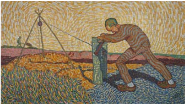
Wilhelm Morgner | Der Brunnenbauer | 1911