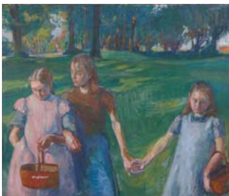
Franz Nöllken | Drei Mädchen in der Pappelallee | 1909