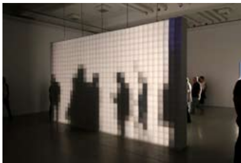
Aram Bartholl | 0,16

Stiftung Konzeptuelle Kunst | RAUM SCHROTH