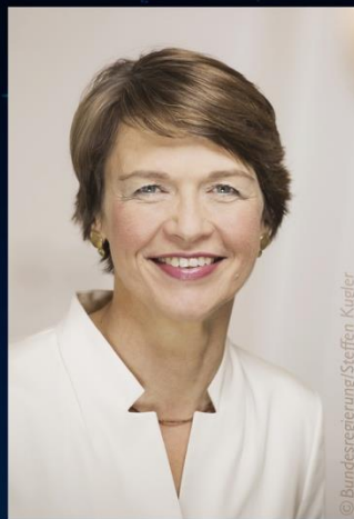
Schirmherrin Elke Büdenbender

Was ist die Wahrheit? Stimmt es, was die Nachbarin da erzählt? Weiß der Influencer mit den vielen Followern wirklich, wovon er spricht? Wo finde ich im Netz vertrauenswürdige Informationen? In Zeiten von Fake News und Verschwörungsmäthen benötigen wir vertrauenswürdige Partner für gesicherte Informationen. Bibliotheken bieten diese Informationen, verhelfen Bürgerinnen und Bürgern gezielt zu (digitaler) Medienkompetenz und laden zu Diskussion über die Themen ein, die unsere Gesellschaft bewegen.