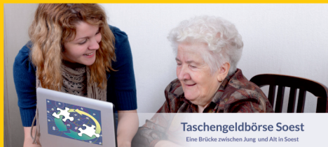
Taschengeldbörse Soest Eine Brücke zwischen Jung und Alt in Soest

Gegen Taschengeld helfen Jugendliche älteren Menschen z.B. bei der Gartenarbeit, im Haushalt oder am PC.