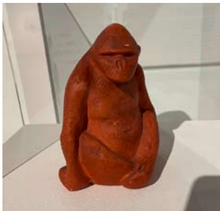
Wilhelm Wulff | Sitzender Gorilla | ohne Jahr

Gezeigt werden in der Ausstellung Werke, die punktuell den künstlerischen Werdegang von Wilhelm Wulff über Zeichnungen und expressionistische Arbeiten aufzeigen, aber auch noch nie öffentlich präsentierte Zeichnungen aus der Zeit seiner frühen Aufenthalte in Paris. Dies sind ausgewählte Arbeiten aus dem Nachlass der Tochter des Künstlers. Die konservatorische Behandlung der insgesamt über 1.600 Papierarbeiten konnte durch die Unterstützung der Stiftung Wilhelm Wulff gelingen.