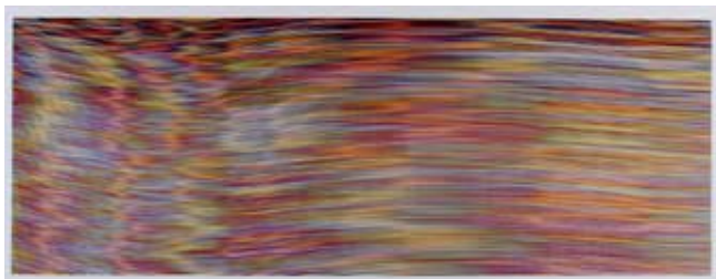
Jill Baroff | Current (Hudson River) 2 | 2017

Andere Werke sind inspiriert durch Beobachtungen der umgebenden Wirklichkeit wie etwa Lichtstimmungen, Architektur oder Wachstum und Farbe von Pflanzen.