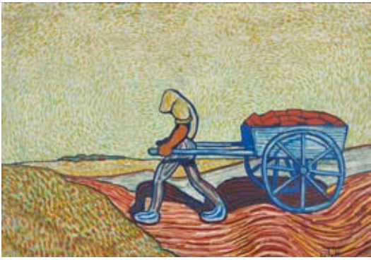
Wilhelm Morgner | Ziegelbäcker mit Karren | 1911