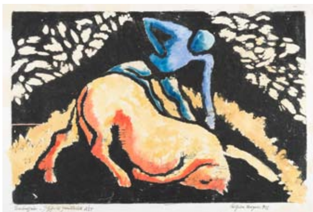
Wilhelm Morgner | Tierdresseur | 1912