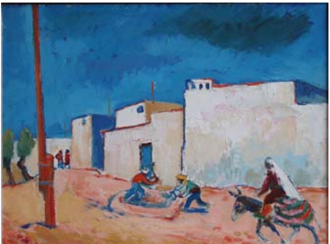
Fritz Duda | Straßenszene in Buchara/Usbekistan, 1962/63

Fritz Duda steht mit seinen Bildern und Grafiken auf dem Boden einer abendländischen Moderne, die vom Spätimpressionismus bis zum expressiven Realismus reicht. Er entführt den Betrachter in eine Welt jenseits aller Brüche und Verwerfungen, die sonst seine politische Biografie ausmachen, in eine Welt der Harmonie und der Schönheit. Seine Bilder offenbaren seine stetige Suche nach einer besseren Welt, die ihn durch die widersprüchlichen Regime des 20. Jahrhunderts geführt haben, aber letztlich nicht überzeugen konnten.