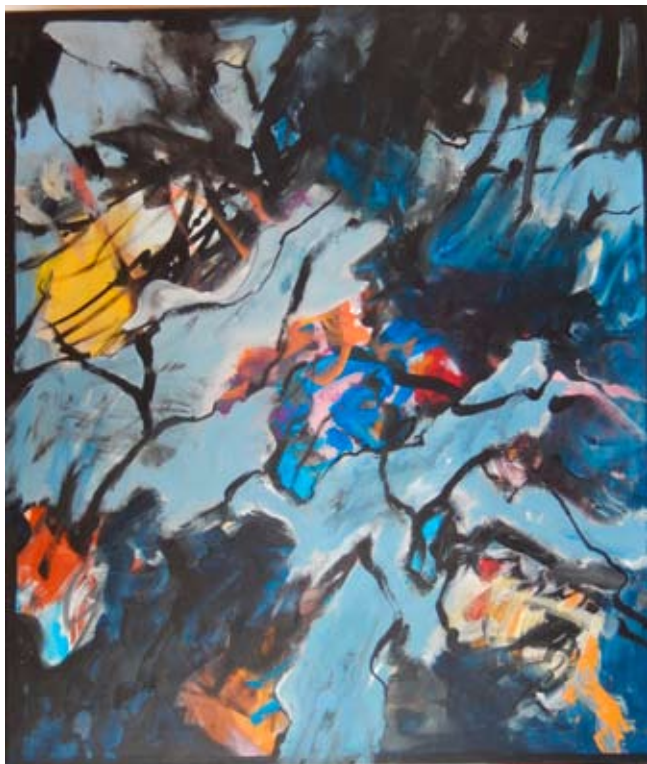
Ingeborg Porsch | Ohne Titel | 2019

In abstrakt expressionistischer Malweise und im Verzicht auf jede gegenständliche Darstellung zeigt sich die Subjektivität von Ingeborg Porsch. Ihre spontane Malweise, gepaart mit kontrollierter Intuition ist eine Façon der Beschreibung von subjektiv Erlebtem, von Empfindungen, persönlichen Vorstellungen und Ereignissen. Ingeborg Porsch zeigt ein Farben- und Linienspiel, scheinbar zufällig auf die Leinwand gebannt, doch lassen sich Prinzipien erkennen, die mit Zufall nur noch wenig gemeinsam haben. So ist in ihren abstrakten und unwirklichen Werken etwas zu finden, das doch manchmal wirklicher ist als erwartet. Abstrakte Bilder veranschaulichen eine andere Wirklichkeit.