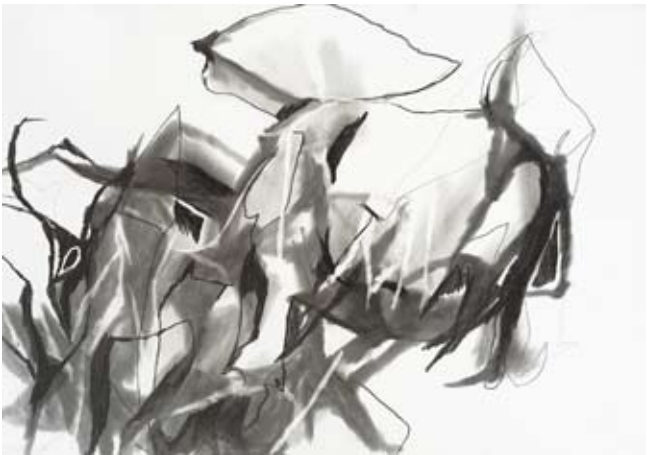
Günter Drebusch | Großer Kromp | 1991