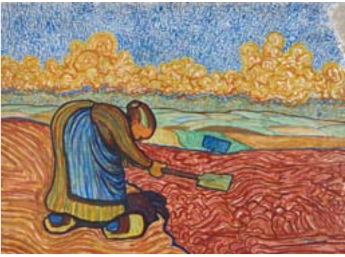
Wilhelm Morgner | Feldarbeiterin | 1911