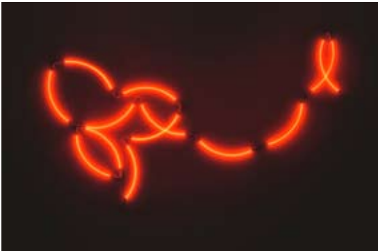
François Morellet | π-Rococo neonly | 2001