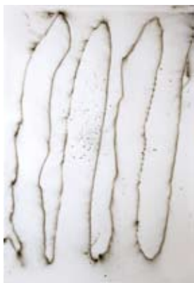
Nadine Fecht | Studie zu Eigentum | 2021

Nadine Fechts Werk weist ein ähnlich großes Spektrum unterschiedlicher Medien auf wie das von Hans Kaiser. Die Verbindung von Zeichnung, Sprache und Sound führt von scheinbar abstrakt erscheinenden Rhythmen und Wiederholungen zu körperlichen Spannungsverhältnissen bis hin zur Erschöpfung, die sich immer auch auf gesellschaftliche Prozesse beziehen. Zur Ausstellung erscheint ein Katalog im Rahmen der „Kaiserreihe“.