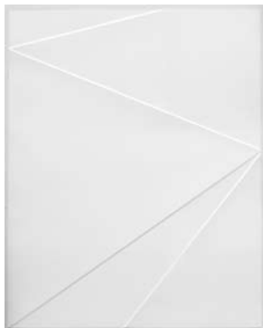
Antje Blumenstein | Lines P25 | 2017