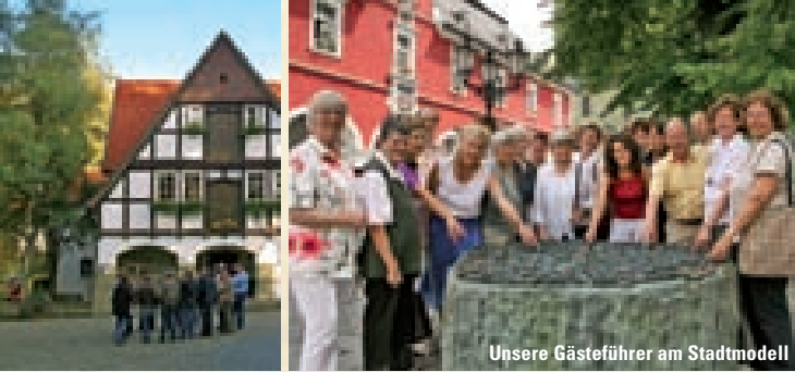
Unsere Gästeführer am Stadtmodell

Fast alle öffentlichen Themenführungen sind auch als Gruppenführungen zu individuellen Terminen buchbar .